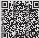
Google Play Store